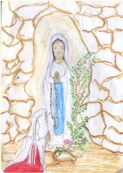
ලූර්ද දේව මාතාවන් ටෙරන්ස් ක්ලියිව් ඇන්තනී 10 ශ්‍රේණිය ලූර්ද දේව මාතා දහම් පාසල පොල්ගහවෙල