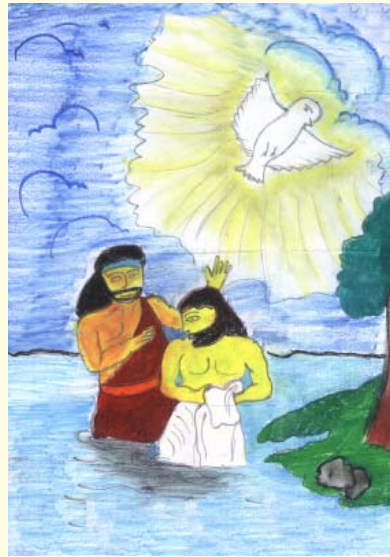
සම්ඳාණන් වහන්සේගේ ස්නාපන මංගල්‍යය තිලිණ හර්මිකා රුද්‍රිගු 12 ශ්‍රේණිය සාන්ත මරියා දහම් පාසල උස්වැටකෙයිසාව