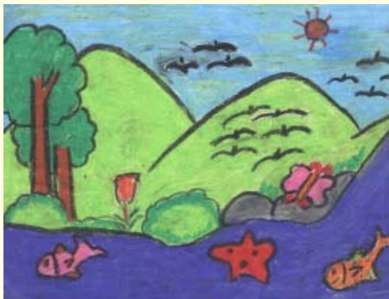
දිය ඇල්ලක් ස්වේන් දේදුනු ප්‍රශංසා 2 ශ්‍රේණිය නිමල මරිය බාලිකා විදුහල කුඩාලේ

ජයලත් අප ස්වාමිදුවගේ කන්‍යාශාලය - මොරටුව