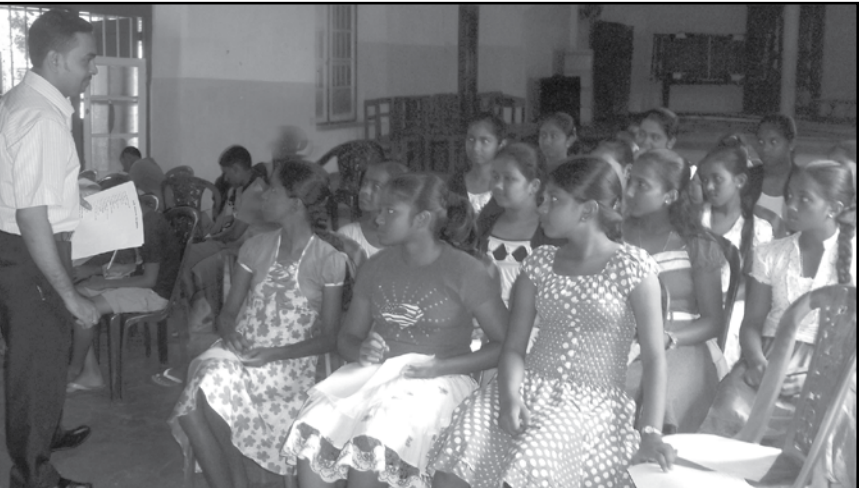
මෙයට සහභාගී වූ ශිෂ්‍ය නායක නායිකාවන් දැනුවත් කරන අයුරු.

මග්ගොන සා. මරියා දහම් පාසලේ 2013 වර්ෂය සඳහා තේරී පත්වූ සිසු නායක නායිකාවන් සඳහා වැඩමුළුවක් පසුගියද දෙවීමැදුරු ශාලාවේදී පැවැත්වුණි. මෙය මෙහෙයවනු ලැබුවේ ප්‍රේමා ප්‍රදීපය සහය සංස්කාරක දේශක, කුමර නයනපීත් මහතාය.