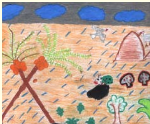
වැසි දිනයක් ඉමල්ෂි දුලිෂනා 05 ශ්‍රේණිය සාන්ත මරියා ප්‍රාථමික බාලිකා විදුහල හලාවත