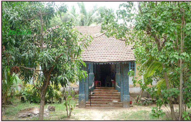
බෙනුවාලිම්හි පිහිටි මවගේ නිවස

මෙහිදී ක්‍රි.ව. 1685 දී ආසියාවේ ප්‍රථම ස්වදේශීය පැවිදි පන්තිය ආරම්භ කළ මෙතුමා එහි අරමුණ ලෙස අදිටන් කර ගත්තේ පීඩනයට පත් ලංකාවට ධර්මදූතවරුන් එවීමටය. එයින් නොනැවතුනු මෙතුමා ක්‍රි.ව. 1687 දී යාවක වෙස්ගෙන සිය සේවක ජෝන් නැමති තරුණයාද කැටුව ලක්දිව බලායන්නට පිටත් වූ අතර යාපනයට යායුතු නැව කුණාටුවකට ලක්ව මන්නාරමට සේන්ද්‍ර විය. එතැන් සිට වසර 24 ක කාලයක් පුරා අප්‍රතිහත ධෙර්සය තුළින් මෙරට තුළ කිතුනු විශ්වාසය යළිදු ගොඩනගන්නට මෙතුමා වෙර දැරීය. එහිදී සිදු කරන ලද දායකත්වය වදනින් කියා විස්තර කළ නොහැකිය. දිවා රැ නොබලා හිස් දෙපතුලින් ඇවිදිමින්, නානාවිධ වෙස් ගනිමින් මෙරට කිතුනු විශ්වාසය දල්වා ලන්නට කුසගිනි දරා, කැලෑ මැදින් දෙපා වැරෙන් ගිය ගමන් මඟ උදෙසා ලාංකේය කතෝලික සභාව සදා එතුමන්ට ණය ගැතිය. මේ පියවර එතුමන්ගේ ජීවිත පිය සටහන් ගැන සොයා බැලීමටයි.