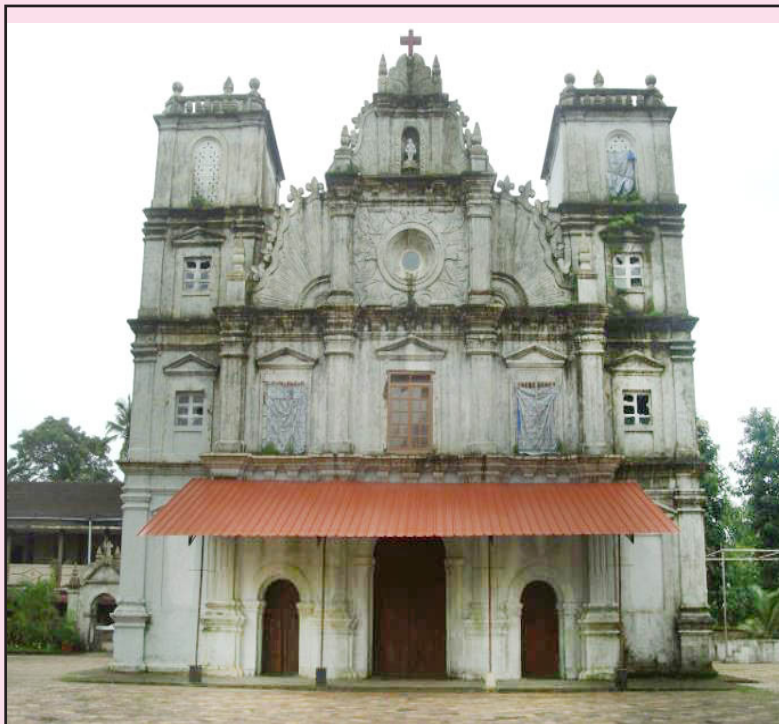
බෙනුවාලිමිහි පිහිටි ශ්‍රී. ස්නාවක ජුවාමි මුනිදුන්ට කැපවූ දේවස්ථානය

ජුසේ වාස් පියතුමා හැදී වැඩුණේ මේ නිවසේ දීය. ප්‍රදේශය අවධිය පිළිබඳ තොරතුරු මෙලෙස හෙළි කරයි. 'ඔහුගේ සම වයසේ දරුවන් කෙළිදෙලෙන් කාලය ගත කරද්දී ඔහු වඩාත් ප්‍රිය කළේ නිසල ස්ථානයකට වී යාමටය. දිනපතා දේව මෙහෙයට සහභාගි වූ ඔහු, පූජාප්‍රසාදිකුමා දිව්‍ය සන්ප්‍රසාදීන් වහන්සේ රෝගීන් වෙත ගෙන යන අවස්ථාවලටද සහභාගි විය. එසේම මළුවන් සොහොන් භූමිය වෙත ගෙන යන අවස්ථාවලට සහභාගි වීම වඩාත් ප්‍රියකල මොහු, රාත්‍රී කාලයේ දැන හඳුනන සියල්ලන් වෙත ගොස් ඔවුන්ගේ යාමටද විශේෂයෙන් මළුවන් වෙනුවෙන් යාමටද ඔප්පු කරන මෙන් ඉල්ලා සිටියේය.