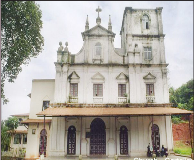
කෝර්ටාලිමි ගමේ පිහිටි ශ්‍රී. පිලිප් හා සිමියෝන් යන අපෝස්තුළුවරුන්ට කැපවූ දේවස්ථානය

ජුසේ වාස් පියතුමා උපත ලබා අට වැනි දින බොහිස්ම කරන ලදී. ඒ බෙනුවාලිමිහි පිහිටි ශ්‍රී. ස්නාවක ජුවාමි මුනිදුන්ට කැපවූ දේවස්ථානයේය. මෙතුමන්ව බොහිස්ම කරන ලද්දේ ගරු ජයසිත්ත පෙරේරා පියතුමා විසින් ය. මෙතුමන්ව බොහිස්ම කරන ලද ප්‍රසාද ස්නාපනීය තටාකය තවමත් දක්නට ඇත.