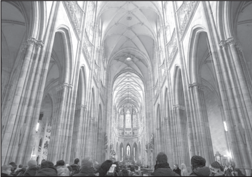
The Gothic St Vitus Cathedral in Prague

St Vitus appears in early lists of Christian martyrs, and probably died during the persecution of Diocletian, which reached its climax in 303. He is a patron saint of Prague, coppersmiths and actors, and his intercession has been invoked against snake bites, lightning and sleeplessness. Chiefly, though, he has been associated with St Vitus's Dance.