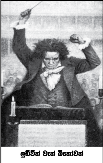
ලුඩ්විග් වැන් බිතෝවන්

දිග මහත ඇඟිලි ඇති අතින් ද වටකුරු කුඩා නිල්පාට ඇසින්ද , යුත්. කිලිටි ඉරුණු ලාබ ඇඳුමකින් සැරසුණු කරුණාවන්ත කමට වැඩිපුර නෑ කමිනො කී, හදිසියෙන් කෝප වී නයෙකු ලෙස පෙනේ පුමිබන, සාමාන්‍ය සමාජ සිරිත විරිතට ගරු නොකළ , අලංකාර සිරුරක අයිතිය නො හිමි වූන තරුණ බිතෝවන් විය. පියානෝව ඉදිරිපිට වාඩි වූ විට (ඔහු) දෙකකුල් කොහේ තිබේද කියා ඔහුටවත් දැනුනේ නැ. බමරයක් ලෙස හිස කැරකුනේය. දෙ අතේ ඇඟිලි යන්ත්‍ර බලයෙන් ලෙස ක්‍රියා ශීලි වූවේය. පියානෝ හඬ අහසට ගිගුම් දුන්නේය. වියලි කැලයක් හිනගත් විට ගින්න දස දෙස ඇවිලෙන්නා සේ පියානෝ හඬ ඉසිරි විසිරි පැතිරී ගියේය.