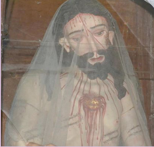
චේතනාසිත ක්‍රිස්තු ප්‍රතිමාව