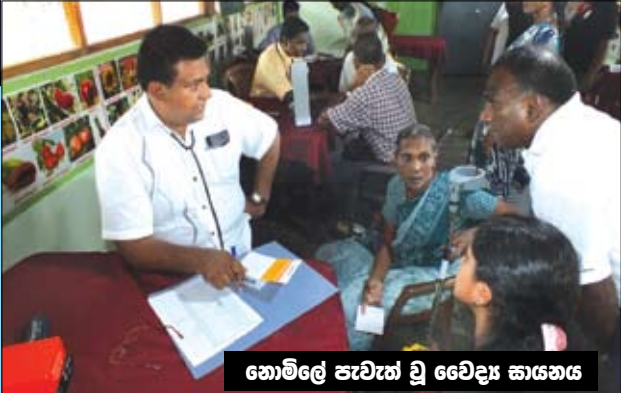
නොමිලේ පැවැත් වූ වෛද්‍ය සායනය