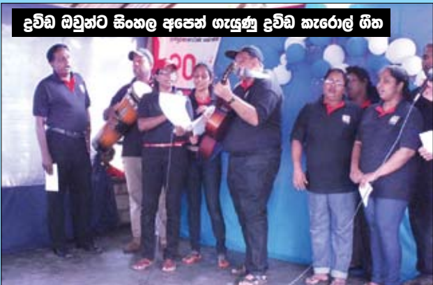
දුවිඬ ඔවුන්ට සිංහල අපෙන් ගැසුණු දුවිඬ කැරොල් ගීත