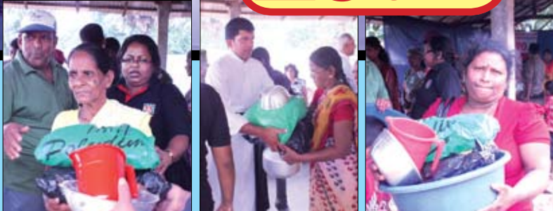
නායකත්වය මිසමිචාසිත් හම නත්තල කැප කර ඔවුන්ගේ අත් තැබුවලින් පිරවූහ