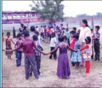
උතුරේ දරුවන් සමඟ ක්‍රීඩා කරමින්