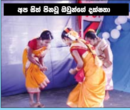
අප සිත් පිහවු ඔවුන්ගේ දක්ෂතා