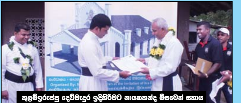
කුලම්ඉරැප්පු දෙව්මැදුර ඉදිකිරීමට නායකත්වය මිසමෙන් සහාය