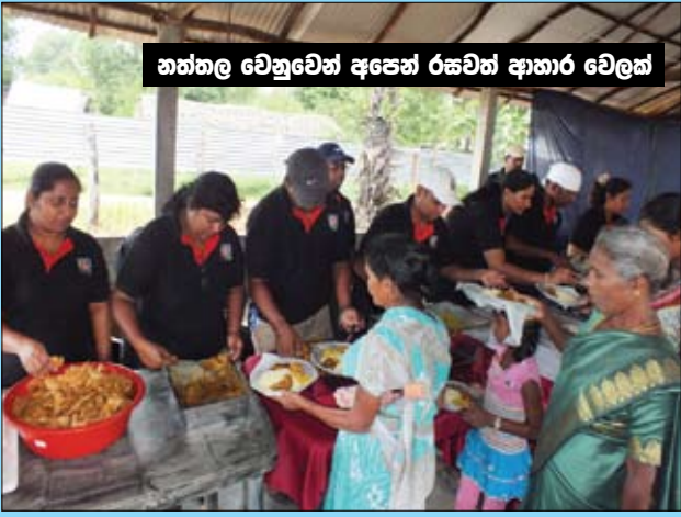
නත්තල වෙනුවෙන් අපෙන් රකවත් ආහාර වෙලක්