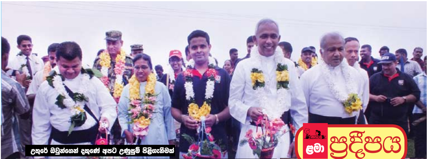
උතුරේ ඔවුන්ගෙන් දකුණේ අපට උණුසුම් පිළිගැනීමක්