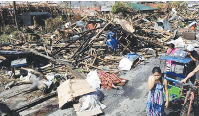
සුන්දුන් ගොඩක් බවට පත් වූ සුන්දර ටැක්ලොඩාන් නගරය

පිලිපීනයේ හයියාන් සුළි කුණාටුව හේතුකොටගෙන එරට ජනතාව විශාල පිරිසකගේ ජීවිත අහිමි වී, නවත් ලක්ෂ සංඛ්‍යාත පිරිසක් අවතැන් වී, උන්හිටි තැන් විනාශ වී ගොස් තිබෙන මේ මොහොතේ ශ්‍රී ලංකාවේ කතෝලික රදගුරු සම්මේලනය බලවත් කම්පාවටත් සංවේගයටත් පත්වී ශ්‍රී ලාංකේය ජනතාව සමග පිලිපීනයේ කතෝලික රදගුරු මඬුල්ලට ශෝකය පළ කර ඇත.