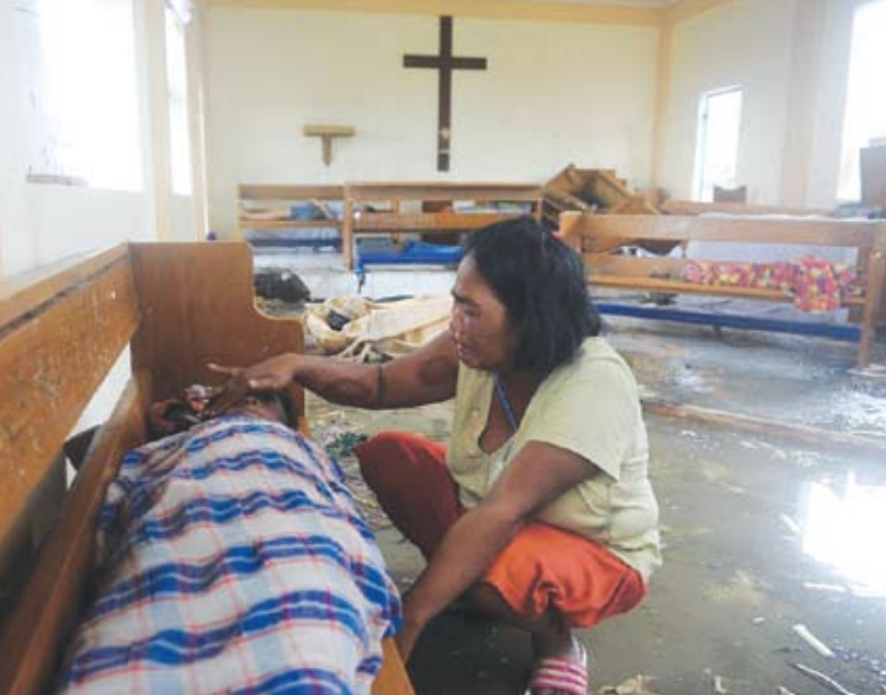
විනාශ වූ කතෝලික දෙව්මැදුරක් තුළ බංකුවක් මත තම මියගිය ඥාතියාගේ සිරුර තැන්පත්කොට දුකින් වැළපෙන පිලිපීන කාන්තාවක්

එහි මෙසේ ද දැක්වේ. ශ්‍රී ලංකා කතෝලික රදගුරු සම්මේලනය මේ දුෂ්කර මොහොතේ දී විපත් පත් ජනතාවටත් ඔවුන්ගේ නෑ හිතවතුන්ටත් ශක්තිය හා ධෛර්යය ලබා දෙන්නැයි දෙවි පියාණන් වහන්සේගෙන් ඉල්ලා සිටින අතර ඒ වෙනුවෙන් යාවිඤා කරන බවට ද ප්‍රකාශ කරයි.