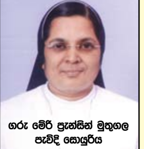
ගරු මේරි ප්‍රැන්සිස් මුතුගල පැවිදි කොසුරිය

“සානුකම්පිත බවින් දැල්වී, විශ්වයම දවාලන්න” නේමාව මුල් කරගනිමින් මෙවර යහපත් එඬේරා පැවිදි නිකායේ ශ්‍රී ලංකා / පාකිස්ථාන ප්‍රාදේශිකයේ 18 වන ප්‍රාදේශීය සමුළුව 2013 නොවැ. 01 දින සිට 09 දින දක්වා රෝමයේ සිට පැමිණි නිකා නායිකාව වන අතිගරු ක්‍රිස්ටි ලෝලර් සහ ඇයගේ අනුශාසකවරියන්ගේ ද සහභාගිත්වය ඇතිව නායකකන්ද යහපත් එඬේරා මුල් ගාහයේදී පැවැත්විණි.