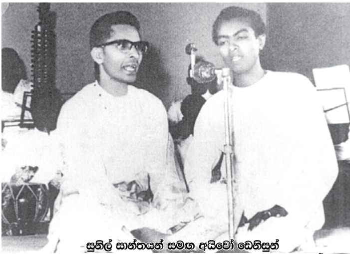
සුනිල් සාන්තයන් සමග අඬවෝ බෙහිසුන්

1946 වසරේ “මිලු පිපිලා” සහ “හදපානේ” යන ඔහුගේ මුල් ම ගීත තුළින් සුනිල් සාන්ත ඉතා සාන්ත වූ නවතම සංගීත රටාවක් අප රටට හඳුන්වා දුන්නේ ය. ඒ ගී සඳහා තාල තරංග එසේත් නැතිනම් තබ්ලාව වැනි තාල භාණ්ඩ වැසුණේ ඉතා අඩු හඬකින්; ඇසෙන නැසෙන තරමට සියුම් ව ය. සුනිලුන් එ සේ කළේ හේතු ඇතිව ය. එනම් ඔහු හඳුන්වා දුන් නවතම සංගීත ආර, උත්තර භාරත නොඑසේ නම් රාගධාරි ගෛලියෙන් මුදා ගැනීමට අවැසි ම පියවරක් සේ සැලකීමෙනි. ශාස්ත්‍රීය ගී පසෙක තිබේවා. සාමාන්‍ය සරළ හින්දි හෝ උච්චි ගීයෙක වුව, එහි රිද්මය උපුප්පාලනු වස්, බොහෝ විට තාල වාද්‍ය භාණ්ඩ ගණනාවක් වාදනය කෙරේ. විවිධ වර්ගවල බෙර පහක්, හයක් හෝ ඇතැම් විට දහයක්, පහළොවක් වුව යොදා ගැනේ. එහෙත් සුනිලුන් ඒ වෙනුවට මුල් තැන දුන්නේ, ගැසුමට, තනුවට හා පද මාලාවට ය. සංගීත භාණ්ඩ ගණනාවක් වැඩිමේ හැකියාව, නොඅඩුව තිබූ සුනිල් සාන්තයන් ගේ ප්‍රධාන වාද්‍ය භාණ්ඩය වූයේ සිතාරය යි. එසේ වුවද ඔහුගේ මුල් අවධියට අයත් ගී කිසිවෙකින් සිතාර හඬ නොඇසිණි. ඊට ද හේතු වූයේ පෙර සදහන් සංගීත ආර මැනවින් තහවුරු වන තෙක්, ඉන්දියානු සංගීතයේ ස්වරූපය දනවන සිතාරයේ හඬ ඊට ඇතුළුවීම වළකාලීමයි.