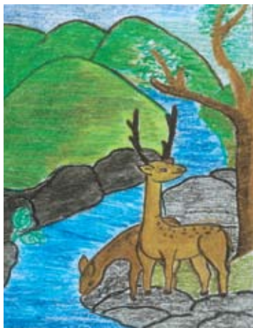
අයි. ඉමාහා ගිම්හානි 8 ශ්‍රේණිය, සා. ඉසිදෝර් දහම් පාසල, තිබ්බටුගොඩ