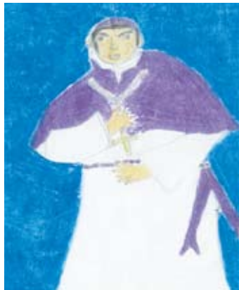
විභංගි මධුකලා නවමාලි 4 ශ්‍රේණිය, සීවලි නවෝද්‍යා මහා විද්‍යාලය බණ්ඩාරවෙල.