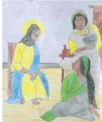
ට්‍රේවෝන් ජයසිංහ 4 ශ්‍රේණිය, සා. ජෝසප් දහම් පාසල, නුගේගොඩ.