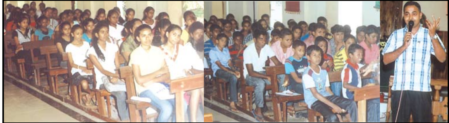
මෙම අවස්ථාව එක් වූ ළමුන්ගෙන් කොටසක් සහ දේශක තුමන් ළමුන්ව දැනුවත් කළ අයුරු

මෙම අවස්ථාවට දහම් ගුරුභවතුන්, මීසමේ සමහි සමාගමිහි පිරිස් හා මීසමි සැදැහවතුන් ද එක්වීම විශේෂත්වයකි. මෙදින ළමුන්ට ලේඛක අභ්‍යාසයක් ලබාදී ඉන් විශිෂ්ටතම නිර්මාණ ළමා ප්‍රදීපය තුළ පළ කිරීමට අවස්ථාව උදාකරදීම ළමුන් ලැබූ සුවිශේෂ අවස්ථාවකි.