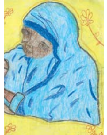
සුහේන් රවිඳු සේනාධීර 3 ශ්‍රේණිය, සා. මරියා මහා විදුහල, මීගමුව.