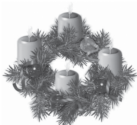
ආගමන සමය සිහිපත් කරවන ඉටි පහන් සතර