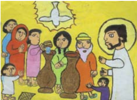
ප්‍රසාදි ලක්ෂානි 5 ශ්‍රේණිය, නිර්මල හෘදයේ දහම් පාසල, පොල්වත්ත. (බුරුල්ලපිටිය මීසම)