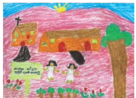
ඩබ්ලිව්. මෙලනි අෂන් 2 ශ්‍රේණිය, සා. පේදුරු, පාචුළු දහම් පාසල, රත්නපුර.