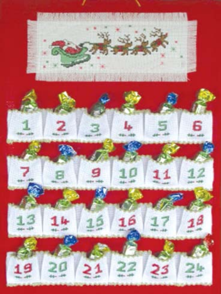
ආගමන දින දර්ශනයක්