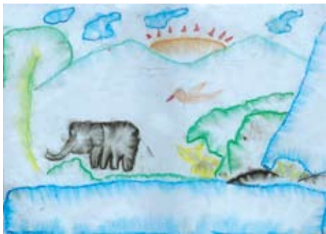
මෙලනි මධුසිකා 4 ශ්‍රේණිය, සා. ජෝශප් ළමා නිවාසය නායකකන්ද.