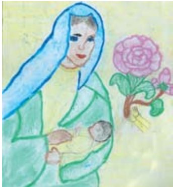
එස්. පියුම් ශාවින්ද්‍රි පෙරේරා 5 ශ්‍රේණිය, ස්නාවක ජුවාමි මුනිදුන්ගේ දහම් පාසල, (උතුරු කළුතර.)