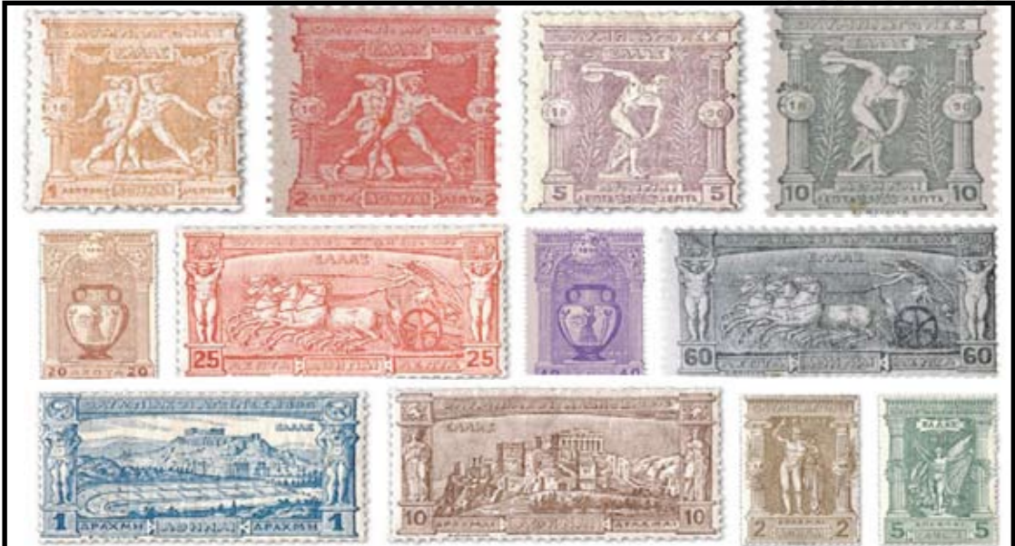
ඔලිම්පික් ඉතිහාසයේ නම රැහැනු මුද්දර කාණ්ඩය

මෙහි දෙවන පේළියේ දැක්වෙන්නේ ඇටික් අම්ෆෝරා නම්වූ මුද්‍රිත පානය (වයින්) බහාලන බඳුනක් දැක්වෙන මුද්දර දෙකකි. අළු පැහැති ලෙප්ටා 20 ක් වූ සහ නිල් පැහැති ලෙප්ටා 40 ක් වූ මුද්දර යි ඒ.