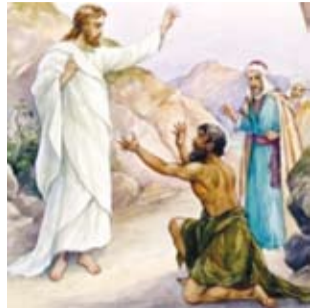
"මම අන්ධයින් සහ කොරන් සහසමන් ආපසු ගෙනෙන්නෙමි"

ක්‍රි.ව. 2012 ක් වූ ඔක්තෝබර් 28 ඉරිදා 147 වෙළුම 22 කලබ සතිපතා පත්‍රය - පිටු 24 - මිල රු. 25.00 QD/12/NEWS/2012 පුවත්පතක් ලෙස ලියාපදිංචි කරන ලදී.