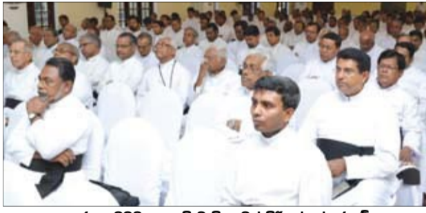
පූජක හමුවට සහභාගි වූ පියතුමන් පිරිසක් සේයාරුවේ

පොළොන්නරුව සමුපකාර ඉවණාගාරයේ පැවැත්වූ මේ සාකච්ඡා වාරයට ප්‍රදේශයේ ජනතා නියෝජනයන් 75 ක් සහභාගි වූහ. අනුරාධපුර රදගුරු අති උතුම් නෝබෙල් අන්ද්‍රාදි නි.ම.නි. හිමිපාණන් සමඟ සමයාන්තර සංවාද කොමිසමේ ලේකම් ගරු රිඩ් ෂෙල්ටන් ප්‍රනාන්දු පියතුමා සම්පන්නයකයන් ලෙස එක්විය. සෙන් සවිය අධ්‍යක්ෂ ගරු පාරිස් ජයමහ පියතුමා ප්‍රමුඛ කාර්ය මණ්ඩලය වැඩසටහනේ සංවිධාන කටයුතු සිදු කළහ.