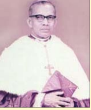
සී. ආර්. ඩික්සන් ඇන්ටනි අනුස්මරණ කමිටුවේ ලේකම්, භාග්‍යවරයට එසවීමේ කමිටුවේ සාමාජික

ශ්‍රී ලංකාවේ ප්‍රථම දේශීය අගරදගුරු - කාදිනල් හිමිපාණන් වූ දේව සේවක අති උතුම් තෝමස් කාදිනල් කුරේ හිමිපාණන්ගේ 24 වැනි ගුණානුස්මරණය තුනී පිදීමේ මෙහෙය ඔක්තෝබර් 29 පොහෝ දින පෙ.ව. 9.30 ට නේවන්ත ජාතික බැසිලිකාවේ දී කොළඹ අගරදගුරු අති උතුම් මැල්කම් කාදිනල් රංජිත් හිමිපාණන්ගේ ප්‍රධානත්වයෙන් පැවැත්වේ.