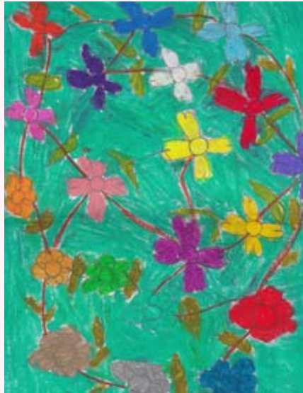
මෝකතරයක් පැනැසරා ඉදුම්ණි වික්‍රමසිංහ 01 ශ්‍රේණිය ශා. ආනා දහම් පාසල වත්තල