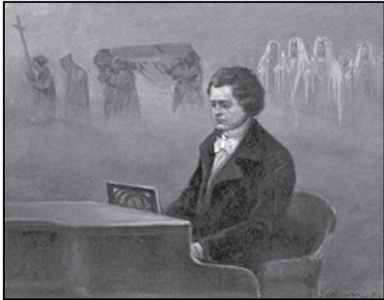
ලුඩ්විග් වැන් බීතෝවන්

ලුඩ්විග් ගේ විසිවෙනි වියේ දී ඔහුට යම් පමණ සැනසීමක් ලැබුණේ, කොලෝන් නුවර ඉතා ධනවත් පවුලක් ඔහුගේ මුළු මෙහෙය ලබා ගන්නට කැමැත්තෙන්, ඔවුන් සමග ජීවත්වීමට බිතෝවන් ද ඔහුගේ සොහොයුරන් දෙදෙනාට ද ආරාධනා කළ බැවිනි. එම ආරාධනය ඉතා සාදරයෙන් පිළිගත් සංගීත සුරයා, එම උසස් පවුලේ ලොකු කුඩා දරුවන්ට බොහෝ මහත්සි වී සංගීතය ඉගැන්වූයේය.