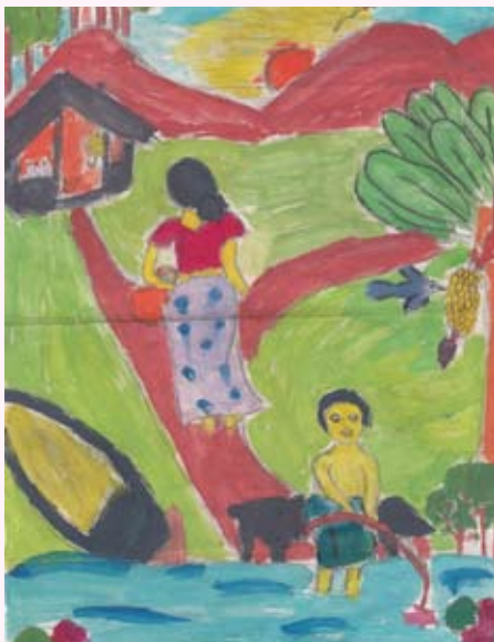
සුන්දර ගම්මානයක් තරුෂි ඉමායා මතුගම 06 ශ්‍රේණිය නිර්මල හාදයේ දේවමාතා දහම් පාසල බංඩිගොඩ (බටගම මීසම)