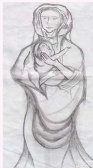
දේව අම්මා රන් ප්‍රනාන්දු 12 ශ්‍රේණිය (කලා අංශය) ආවේ මරියා බාලිකා විදුහල - මීගමුව