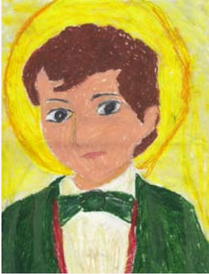
ශ. ද්‍රෝණික සාවියෝ මුනිතුමා ධීරණා උත්කර්ෂි පෙරේරා 04 ශ්‍රේණිය සා. බ්‍රිජට් කනායාරාමය කොළඹ 07