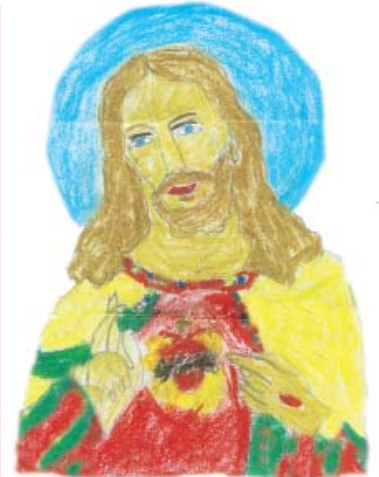
අපගේ ජේසු සමිඳුන් දිල්කාන් සදුරුවන් 4 ශ්‍රේණිය සා. අන්තෝනි දහම් පාසල - දුනකදෙනිය