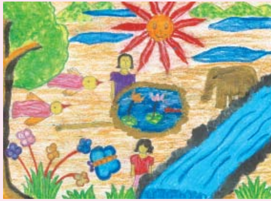
පරිසරයේ අසිරිය හෂිණි අමාෂා ලෝවී 8 ශ්‍රේණිය මහමායා බාලිකා විදුහල - මහනුවර