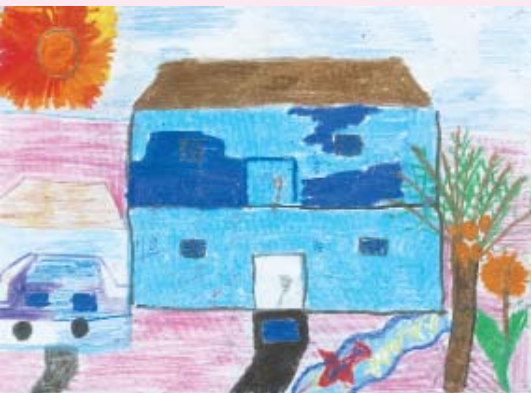
අපේ ගෙදර සමීෂා රන්ජලී 3 ශ්‍රේණිය ජයලත් අප ස්වාමිදුගේ කනකාරාමය මොරටුව