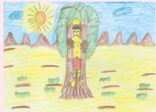
ශු. සෙබස්තියන් මුනිතුමා නිර්මාල් රොෂාන්ත පෙරේරා 3 ශ්‍රේණිය ශාන්ත මයිකල් දහම් පාසල කොරළුවැල්ල