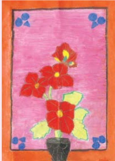
මල් බඳුනක් ලක්ෂානි රංගිකා 7 ශ්‍රේණිය බප/ගම් මද්දුම බණ්ඩාර මහ විදුහලය