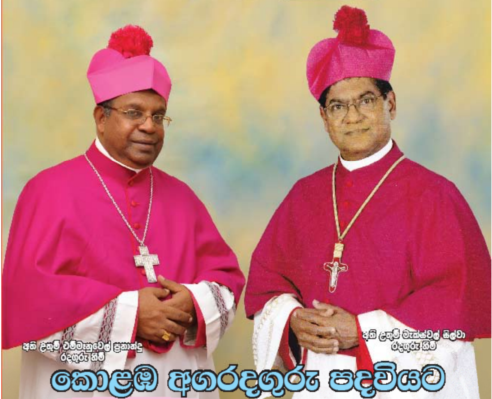
අති දිගුම චරිතයකුවෙල් ප්‍රකාශන රදගුරු හිමි