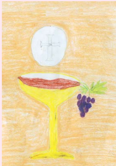
දිව බොදනින් සවිමත් වෙමු රෙබේකා වීරසිංහ 7 ශ්‍රේණිය සියලු සාන්තුවරයන්ගේ බාලිකා විදුහල - බොරැල්ල