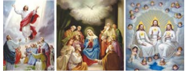
இயேசுவின் வின்னேற்பு - 17 தூய ஆவியின் வருவியா - 24 மூவொரு கடவுள் 31