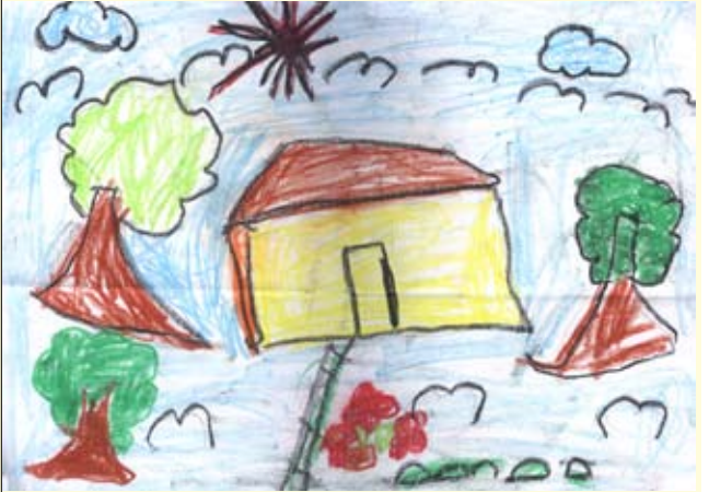
අපේ ගෙදර මිසිත රමේන්

ප්‍රච් අපේ චිත්‍ර පිටුව සඳහා ඔබ අදින චිත්‍ර, පාසලේ හෝ දහම් පාසලේ පංතිභාර ගුරුතුමාගේ සහතිකය සමග ඔබේ නම, පංතිය, පාසල ඇතුළත්ව ඔබේ පෞද්ගලික ලිපිනය හා දුරකථන අංකය ද සහිතව යොමු කරන්න. "ප්‍රච් අපේ චිත්‍ර පිටුව" ළමා ප්‍රදීපය, අංක 02, ඥානාර්ථ ප්‍රදීපය මාවත, කොළඹ 08.