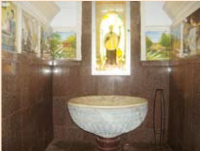
බෙනුවාලිමිහි පිහිටි ශ්‍රී. ස්නාවක ජුවාමි මුනිදුන්ට කැපවූ දේවස්ථානය

ජයසින්ත් පෙරේරා පියතුමා විසින් 1651 අප්‍රේල් මස 28 වැනි දින බොහිස්ම කරන ලදී. ඒ බෙනුවාලිමිහි පිහිටි ශ්‍රී. ස්නාවක ජුවාමි මුනිදුන්ට කැපවූ දේවස්ථානයේය.