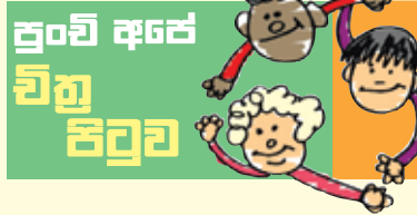
ප්‍රච් අපේ චිත්‍ර පිටුව

02 ශ්‍රේණිය ජයලත් අප ස්වාමීන්ද්‍රගේ කන්‍යාරාම - මොරටුව