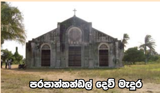
පරපාත්තන්ඩල් දෙවි මැදුර