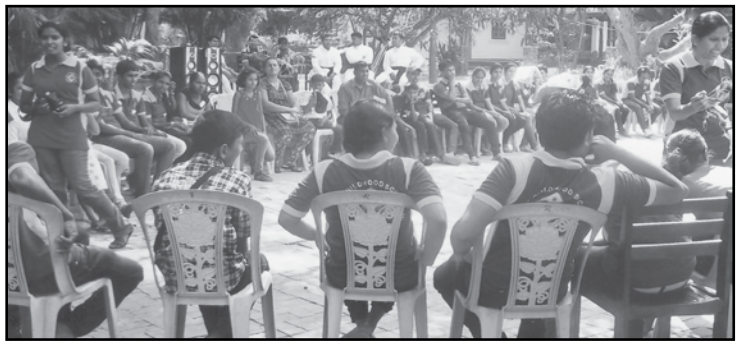
කොකුම් වාසනා ජයරුවන්

හලාවත පදවි ධර්මදූත සජීවක නත්තල් උත්සවය පසු ගියද පැවැත්වුණි. පුත්තලම් මිසමි සේවක ගරු ජෙයරාසා මිසමි සහයක ගරු ෂෙහාන් ෆර්ඩිනන්ඩස් පියතුමන්ලාගේ හා පදවි ධර්මදූත අධ්‍යක්ෂ ගරු නිශාන්ත ජානක පියතුමා ගේද සහභාගිත්වයෙන් පැවැත්වුණි. පදවියේ දිසා හතරට අයත් සජීවක සජීවිකාවන් මීට සහභාගී වූ අතර මෙම උත්සවය පුත්තලම් දිසා ධර්මදූත සජීවක සජීවිකාවෝ එක්ව සංවිධානය කළහ. මෙදින අවස්ථාවක් සේයාරුවෙහි දිස්වේ.