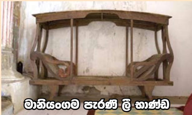
මානියංගම පැරණි ලී භාණ්ඩ