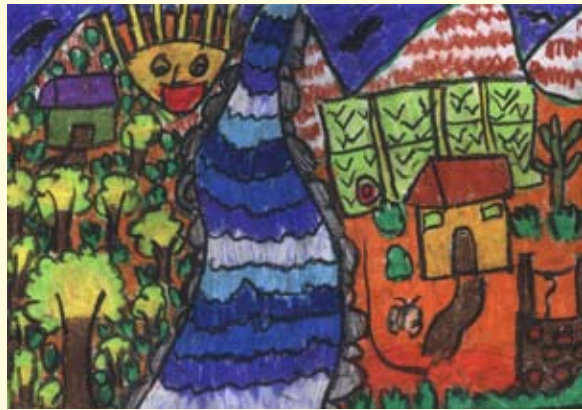
ගමක අසිරිය හරැෂිකා හෙන්ම් වීරසිංහ