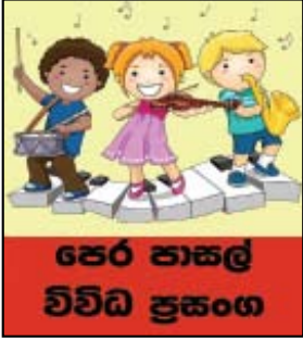
පෙර පාසල විවිධ ප්‍රසංග

පමුණුවල ශ්‍රී. ජුසේ මුනිදුගේ දහම් පාසලේ වාර්ෂික කෘත ප්‍රදනෝත්සවය හා විවිධ ප්‍රසංගය පසුගියද පැවැත්විනි.