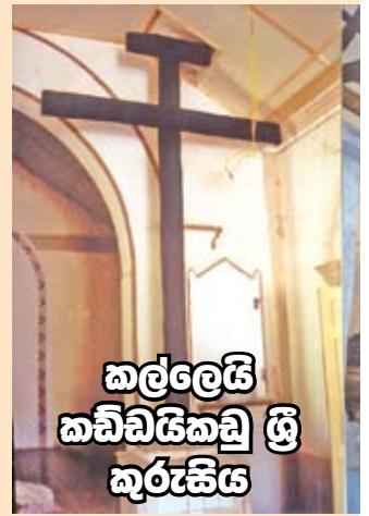
කල්ලෙයි කඩ්ඩියකඩු ශ්‍රී කුරුකිය