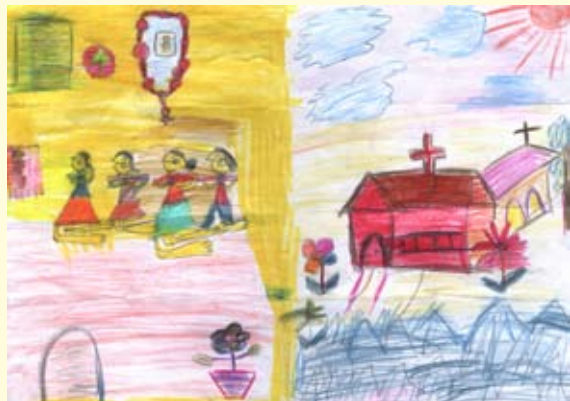
දෙවිඋන්ට යාවිඤා කරමු අදිෂා හිහාරි ෆොන්සෙකා

04 ශ්‍රේණිය සාන්ත ජෝශප් විදුහල (මීගමුව ශාඛාව)