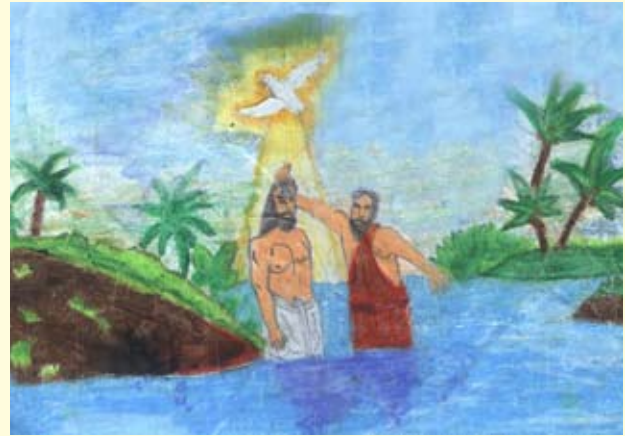
ජේසුස් වහන්සේගේ බෞතිස්මය ජනිත ආලෝක සිල්වා

04 ශ්‍රේණිය සාන්ත ජෝශප් විදුහල (මීගමුව ශාඛාව)