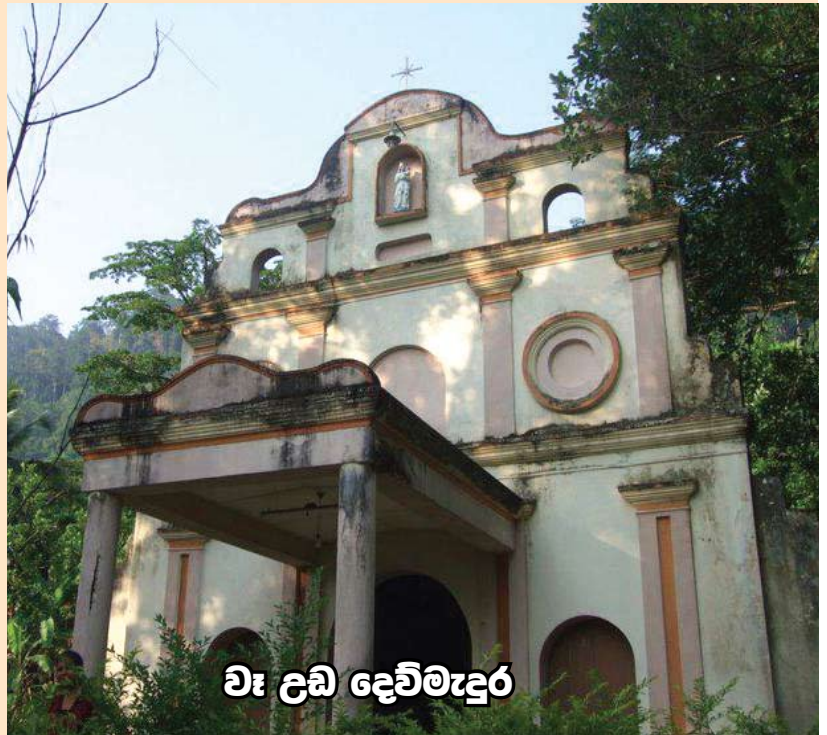
වෑ ලඩ් දෙවිමැදුර