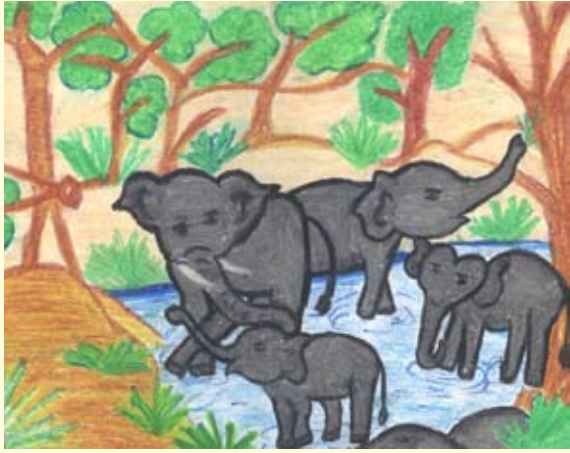
අලි රංචුවක් අමාෂ දෙවිමි ප්‍රනාන්දු 08 ශ්‍රේණිය සා. මිබායෙල් අගුණ දහම් පාසල නාගොඩ, කළුතර