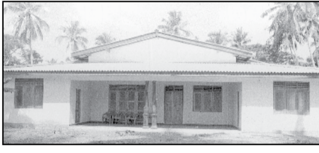
සේයා - ජානක ප්‍රනාන්දු. සටහන - මැල්කම් සිල්වා

කතෝලික දේවස්ථාන 05 කින් සමන්විත කොටුගොඩ මිසමි අංගසම්පූර්ණ මිසමි ගෘහයක් නොතිබීම විශාල අඩුපාඩුවක් විය. එම සියලු බාධක හා අඩුපාඩු ජයගනිමින් අදට ඔබ්බ පරිදි සියලු අංගෝපාංගයෙන් යුතුව ඉදිකෙරුණු නව මිසමි ගෘහය අති උතුම් මැල්කම් කාදින්ට් රංජිත් හිමිපාණන් අතින් නොවැම්බර් 17 බ්‍රහස්පතින්දා පස්වරු 5.00 ට විවෘත කෙරේ. මෙහි නියමුවා ලෙස මිසමි සේවක ගරු ජුඩි ලක්මන් පියතුමා පෙරටුකොට කොටුගොඩ මිසමි ධර්මසේවා සභාව, ක්‍රිස්තියානි කම්කරු ව්‍යාපාරය, වැඩිහිටියන්ගෙන් සැදුම්ලත් කණ්ඩායම්, තරුණ කොටස් මේ සඳහා මූල්‍ය ආධාර රැස්කිරීමේ කටයුතුවල නිරතවූහ.