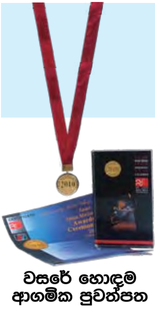
වසරේ හොඳම ආගමික පුවත්පත