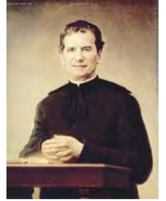
1815 - 2015 දොන් බොස්කෝ තරුණයන්ගේ පියා, ගුරුවරයා සහ මිතුරා නොව. 19 සිට 30 දක්වා ශ්‍රී ලංකාවේ ගෞරවාවාසාව