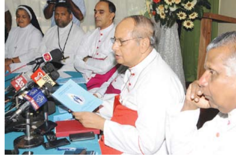
අනුශාසනා පත්‍රය මාධ්‍යයට පැහැදිලි කළ මොහොතේදී...

වෙමින් පවතින වකවානුවක් එළඹ ඇති බව පෙන්නා දුන්නේ ය. එවැනි විදේශ මැදිහත්වීම් හෝ අනපෙවීම් කිසිසේත් අවශ්‍ය නැති බව මේ අවස්ථාවට සහභාගි වූ සෙසු රදගුරු ගිම්පාණෝ ද පෙන්නා දුන්හ.