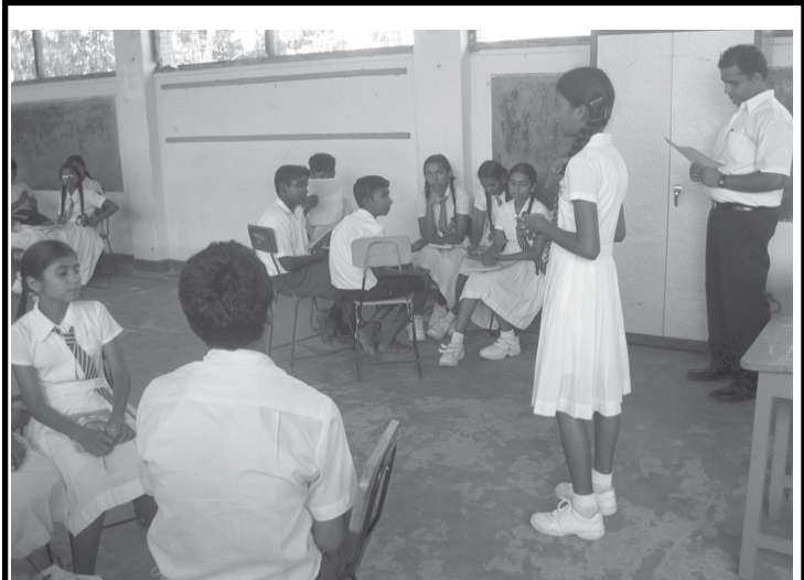
පසුගියද හලාවත පදවි සංක්‍රමණික සේවා කොමිසම මගින් බණ්ඩිරිප්පුව මධ්‍ය මහා විද්‍යාලය හා දුම්මලකොටුව මධ්‍ය මහා විද්‍යාලය යන පාසල් හි පසු විපරම් වැඩසටහන් පැවැත්වුණි. මෙදින අවස්ථාවක් සේයාරුවෙහි දිස්වේ.

මුළු ලොවම තනි යායක් බවට පත් වෙමින් විසල් ලොව අල්ප වූ ගම්මානයක් බවට පත්ව ඇති බවට අපි උදම් ගී ගයමු. නමුත් සභාවාරයේ ගුණදම් වේරමිහ සුළගේ පැටලී සුව හසක් ඇතට ගොස් ඇති බව පිළි ගැනීමටවත් අද අප සූදුනම් නැත. කුණු කන්දේ සේසැදුම්ලත් වන්මන් සමාජයේ දෙනෙතට කඳුළැලි එක් කොට තෙරක් නොපෙනෙන අනාගතයදෙස බලන්නට නොතින් ආශා වෙන් දෙපා ඔසවන අවිහිංසක ළමයා නිරායා සයෙන් නැවතත් මහ කතරේ තනි වන්නේ අද සමාජය දරුවාගේ අනාගත දොරටුව අහුරා ඇති හෙයිනි. විවිධ ආගම් වලින් ඔදනෙදව පැමිණි ලාංකේය සමාජයේ ගුණ දම් ගැන උදම් ඇනුව ද තදනන්තරව අනෙක් පසට ඒ මුවින්ම කෙතරම් දැ කෙළසනවා ද? මහත් සමාජය ම තරගකාරීත්වයෙන් ධනය පසුපස මුර බල්ලන් සේ දුවද්දී අසරණ වන ලමා මනස අඬන හැටි නොඇසෙන්නේ ලාභය නම් සන්ධ්‍යා නාදය සිව් කොණින් නද දෙන්නට පටන් ගෙන අවසන් බැවිනි.