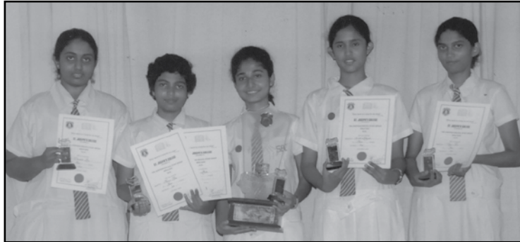
ජ්‍යෙෂ්ඨ අංශයේ ගුරුතාවය දිනූ කණ්ඩායම