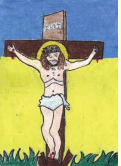
අපගේ ගැලවුම්කරුවාණෝ හිරුණි ඉමාෂා මාරසිංහ 05 ශ්‍රේණිය සාන්ත මරියා ප්‍රාථමික බාලිකා වීදුහල හලාවත