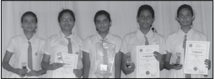
කනිෂ්ඨ අංශයේ ගුරුතාවය දිනූ කණ්ඩායම