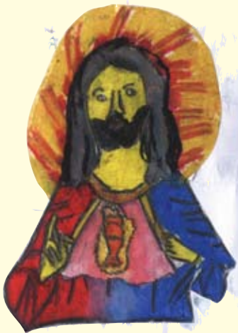
දිව්‍ය හෘදයේ ජේසුහි භාග්‍ය සල්ගාදු 05 ශ්‍රේණිය, සා. සෙබස්තියන් වීදුහල - මොරටුව

ප්‍රංචි අපේ විභූ පිටුව ප්‍රංචි අපේ විභූ පිටුව සඳහා ඔබ අදහස් වනු, පාසලේ හෝ දහම් පාසලේ පාසලාංගීය ශාස්ත්‍රාගාරයේ සහතිකය සමඟ ඔබේ නම, පාසල, පාසල අංකයන් ඔබේ පොදුගිණි ලිපිනය හා දුරකතන අංකය ද සහිතව යොමු කරන්න. "ප්‍රංචි අපේ විභූ පිටුව" ප්‍රංචි ප්‍රදීපය, අංක 02, ඥානාර්ථ ප්‍රදීපය මාවත, කොළඹ 08.