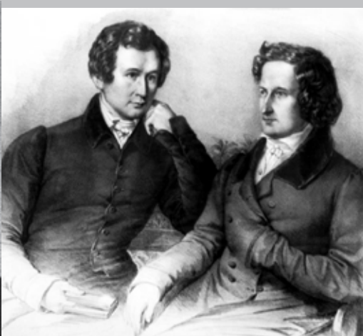
ග්‍රිම් සොහොයුරන් දෙදෙනා